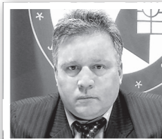
ПРЕДСЕДЕТЕЛЬ ОБКОМА ПРОФСОЮЗА