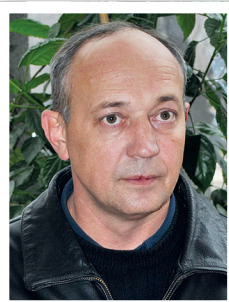
БРИГАДИР ОБЖИМНОГО ЦЕХА, ОБЩЕСТВЕННЫЙ ИНСПЕКТОР ПО ОХРАНЕ ТРУДА

- Мы знаем об этой проблеме и ищем пути ее решения. Сейчас в нескольких структурных подразделениях предприятия идет проработка введения трех комплектов спецодежды. Первый для ежедневной носки, второй комплект сменный, а третий запасной.