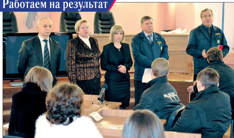
Студенты ЗПМЛ на встрече в профкоме комбината.