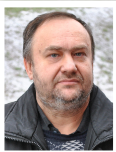
НАЧАЛЬНИК БЮРО РЕМОНТА И ОБСЛУЖИВАНИЯ СТАНКОВ ЧПУ МЕХАНИЧЕСКОГО ЦЕХА

Общественные инспекторы положительно оценили работу семинара и выразили общее мнение, что это очень практичная и удобная форма общения и учебы, которая позволит напрямую узнать от первых лиц предприятия и профсоюза о перспективах и работах в вопросах охраны труда, а также задать актуальные для трудовых коллективов вопросы.