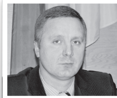
ЗАМЕСТИТЕЛЬ ПРЕДСЕДЕЛЯ ОБКОМА

В 2009 году он был избран заместителем председателя обкома.