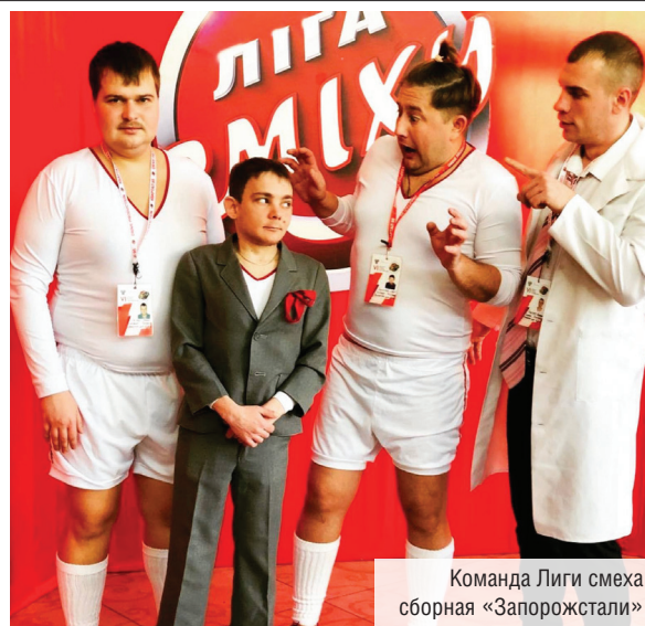
Команда Лиги смеха сборная «Запорожстали»