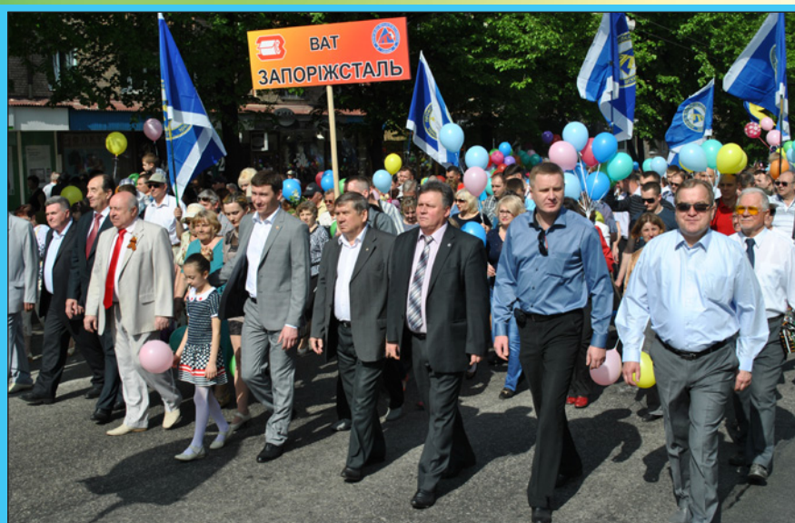
1 мая в Запорожье состоялась многотысячная Первомайская демонстрация, в которой приняли участие работники различных предприятий города. Колонну профсоюза металлургов и горняков возглавлял трудовой коллектив «Запорожстали».